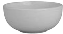
NON STACKABLE BOWL

25 cl | 12 APRARN08Q064025 15 cl | 12 APRARN08Q064015