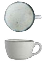
TITANIUM CUP NON STACKABLE