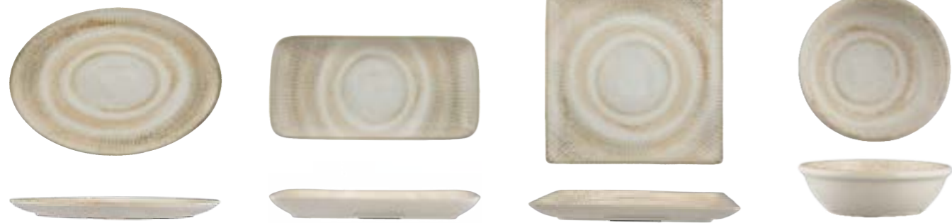
OVAL PLATE WITH FOOT

21cm | 6 DVCARN09U012001 18cm | 6 DVCARN09U012018