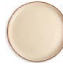
COUPE PLATE 30 cm 6 AARARN034011030 27 cm 6 AARARN034011027 21 cm 12 AARARN034011021 17 cm 12 AARARN034011017