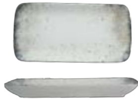
GN RECTANGLE PLATE

21cm | 6 DVCARN04X012001 18cm | 6 DVCARN04X012018