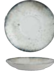
SAUCER BIG STANDARD