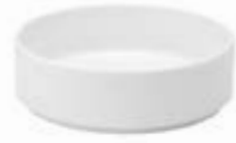
STACKABLE SALAD BOWL IVORY 21 cm 118 cl 3 📦 APRARN000021021 18 cm 72 cl 3 📦 APRARN000021018