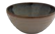
NON STACKABLE BOWL 16 cm 4 AARARNC94022016 14 cm 4 AARARNC94022014