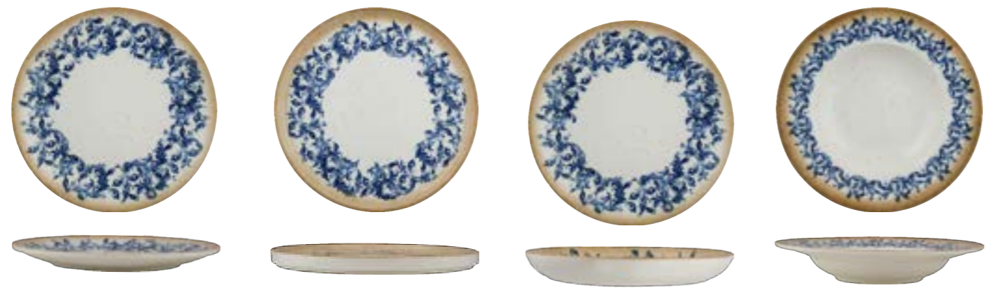
ROUND RIMLESS PLATE

27cm | 6 ☼ DVCARN11K011027 24cm | 6 ☼ DVCARN11K011024 21cm | 12 ☼ DVCARN11K011021 18cm | 12 ☼ DVCARN11K011018