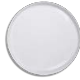
STRAIGHT PLATE IVORY 30 cm ✦ 4 📦 ASEARN000011030