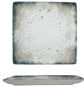
PLATTER JULIET SQUARE

27X27cm | 3 DJSARN04X011005 16X16cm | 12 DJSARN04X011001