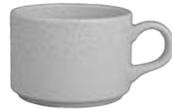
STACKABLE TEA CUP