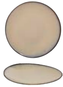
VITAL COUPE ELEVATED PLATE 29 cm 8 AVCARN257111029 27 cm 12 AVCARN257111027 21 cm 12 AVCARN257111021