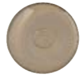
VITAL COUPE ELEVATED SAUCER 16 cm 12 AVCARN257014016 13 cm 12 AVCARN257014013