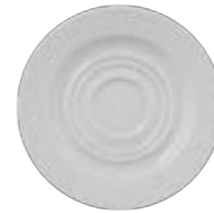
COFFEE / TEA CUP SAUCER

32cm | 12 APRARN08Q015032 28cm | 12 APRARN08Q015028 22cm | 12 APRARN08Q015022