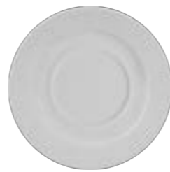
SOUP BOWL SAUCER