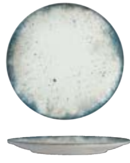
ROUND RIMLESS PLATE

29cm | 6 DVCARN04X011029 27cm | 6 DVCARN04X011027 24cm | 6 DVCARN04X011024 21cm | 12 DVCARN04X011021 18cm | 12 DVCARN04X011018