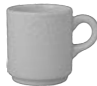
STACKABLE ESPRESSO CUP