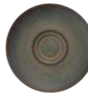
SAUCER 16 cm 12 AMKARNC94014016 13 cm 12 AMKARNC94014013