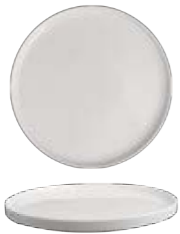
SHORT RIM PLATE 27 cm ✦ 4 📦 ASEARN000B11027 25 cm ✦ 4 📦 ASEARN000B11025 21 cm ✦ 4 📦 ASEARN000B11021