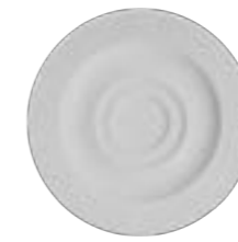
ESPRESSO CUP SAUCER