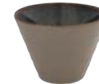
STACKABLE CONICAL BOWL 11 cm 6 AARARNC94034011