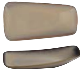
VITAL RECTANGLE PLATE 29X15.5 cm 6 AVRARN257011029 24X13 cm 12 AVRARN257011024