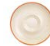
SAUCER 16 cm 12 AMKARN034014016 13 cm 12 AMKARN034014013