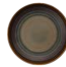
COUPE DEEP BOWL 25 cm 6 AARARNC94022025