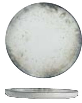
SHORT RIM SELAS STACKABLE PLATE

29cm | 6 DVCARN04X011029 27cm | 6 DVCARN04X011027 24cm | 6 DVCARN04X011024 21cm | 12 DVCARN04X011021 18cm | 12 DVCARN04X011018