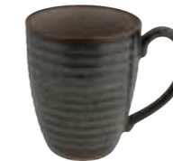
RIBS NON STACKABLE MUG 30 cl 12 ARTARND61054030

Note:- All Artisan SKU'S will be available in this colour This is a reactive glaze application. Piece to piece variation is the essence of the glaze.