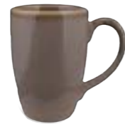
NON STACKABLE MUG 30 cl 6 APRARN257054030