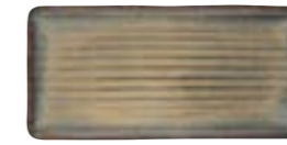
RECTANGULAR PLATTER 36X20 cm 6 AARARNC94011002 30X15 cm 6 AARARNC94011001