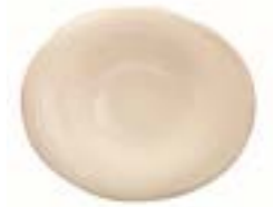
WIDE RIM BOWL 29 cm 6 AARARN034022029