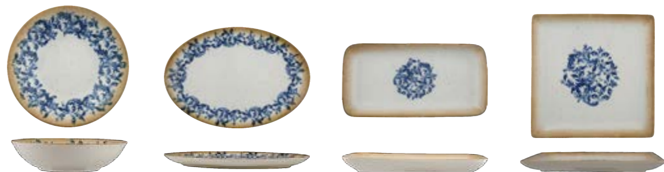
COUPE DEEP PLATE

21cm | 6 ☼ DVCARN11K012001 18cm | 6 ☼ DVCARN11K012018