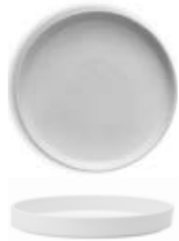
SELAS STACKABLE PLATE IVORY 25 cm ✦ 4 📦 ASEARN000A11025 21 cm ✦ 4 📦 ASEARN000A11021