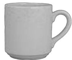
STACKABLE COFFEE CUP