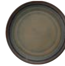
COUPE PLATE 30 cm 6 AARARNC94011030 27 cm 6 AARARNC94011027 21 cm 12 AARARNC94011021 17 cm 12 AARARNC94011017