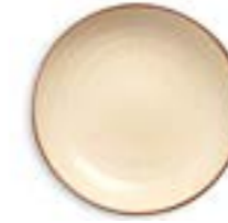
COUPE DEEP BOWL 25 cm 6 AARARN034022025