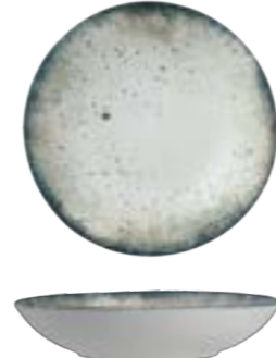
COUPE DEEP PLATE

26cm | 6 DPRARN04X012026 23cm | 12 DPRARN04X012023