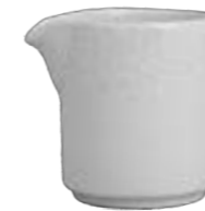
CREAMER WITHOUT HANDLE