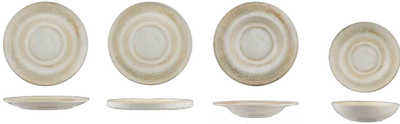
ROUND RIMLESS PLATE

27cm | 6 DVCARN09U011027 24cm | 6 DVCARN09U011024 21cm | 12 DVCARN09U011021 18cm | 12 DVCARN09U011018